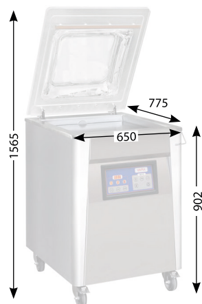
Außenmaße (mm) Outer dimensions (mm) Cotes extérieures (mm)